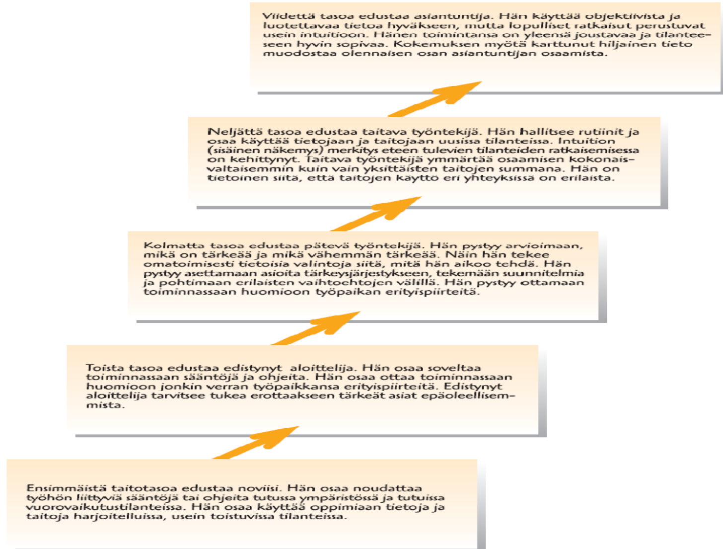
Kuvio 4. Ammatin hallinnan taitotasot (mukaillen Kankaanpää 1987, Dreyfus & Dreyfus 1985, Hätönen 2001).